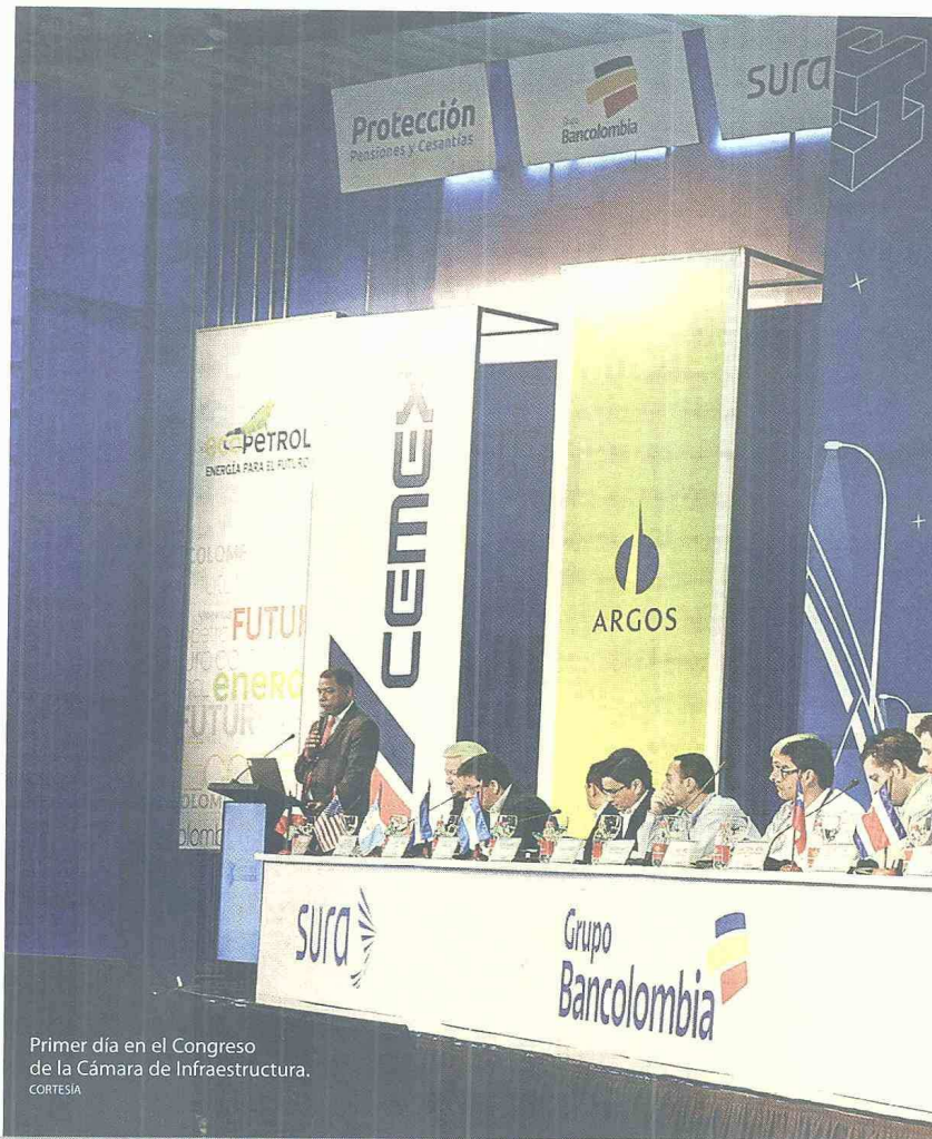
Primer día en el Congreso de la Cámara de Infraestructura.

EL TIEMPO EN EL QUE SE REDUCIRÁ EL PROCESO DE EXPROPIACIÓN PREDIAL.