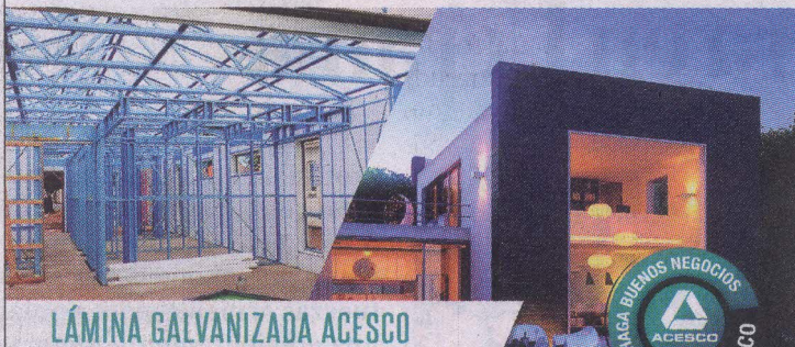
LÁMINA GALVANIZADA ACESCO