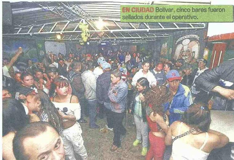
EN CIUDAD Bolívar, cinco bares fueron sellados durante el operativo.

En un operativo, las autoridades sellaron un 'amanecedero' en el barrio Lucero, por no cumplir con las normas de seguridad y emergencia.