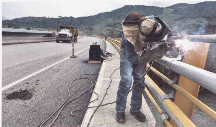
La inversión para las concesiones de cuarta generación es una de las más altas del continente. / Oscar Pérez

Y aunque hasta el momento se han adjudicado seis proyectos (de un total de nueve que conforman el primer tramo de obras), detalla Fierro, las constructoras han dado un primer paso a la hora de asegurar las concesiones al presentar una garantía de seriedad de la propuesta ante las firmas de seguros que ofrecen pólizas de cumplimiento, las cuales permiten contratar con el Estado y protegen al Gobierno de los perjuicios que cause la falla de un contratista.