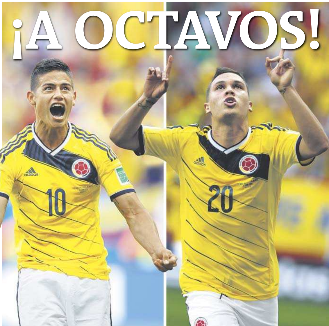
James Rodríguez y Juan Fernando Quintero fueron las figuras en el 2-1 de Colombia sobre Costa de Marfil. El elenco clasificó a octavos del Mundial, por segunda vez en la historia. Ayer, hace 24 años, se había logrado igual paso en Italia-90. PÁG. 46