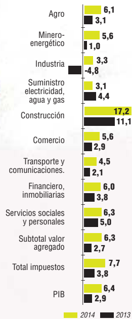
Gráfico: Dpto. de Infografía - JT (N3)

Todos los sectores en terreno positivo (Variación porcentual enero-marzo, cifras preliminares)