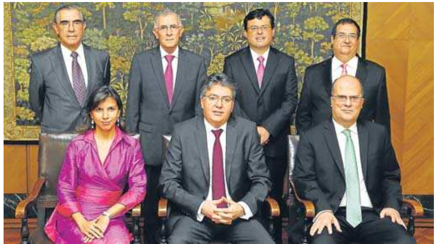
La junta directiva del Banco de la República (foto) se reunirá hoy para revisar los principales indicadores económicos y decidir si aumenta o mantiene la tasa de intervención en 3,75%.

Los principales sectores que soportan la economía colombiana mantuvieron crecimientos positivos en el primer trimestre, mientras que otros con menos participación en el PIB sobresalieron.