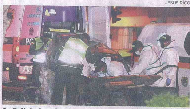
La Policía de Tránsito realizó en la noche de ayer la diligencia de levantamiento en la zona del accidente.

Un furgón sin frenos fue la causa, según las primeras hipótesis de las autoridades, de un múltiple accidente de tránsito que cobró dos vidas en la carrera 46 con calle 100. 7B