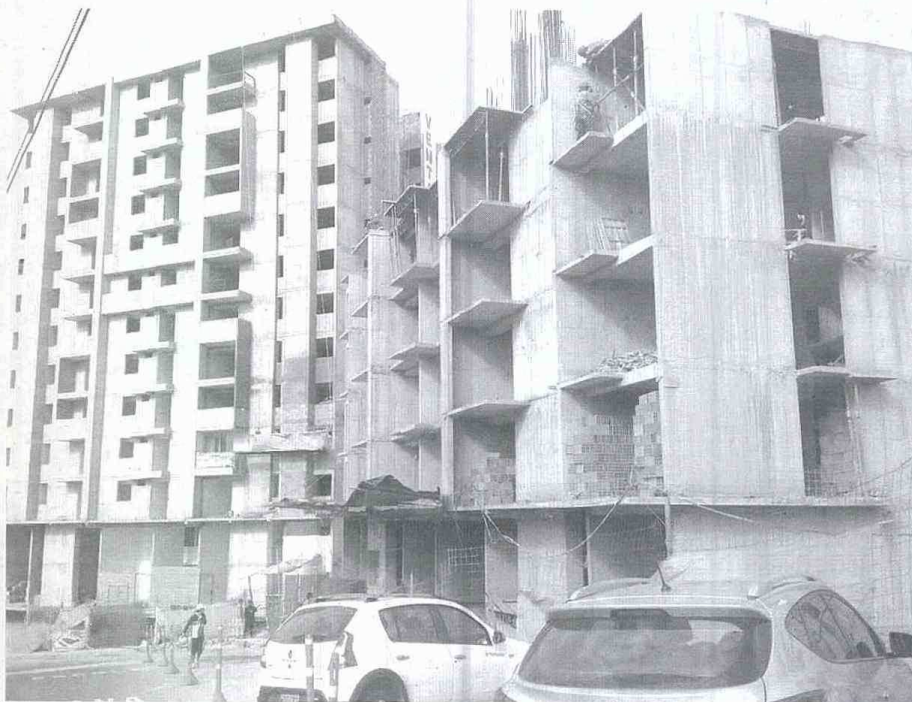
EL SECTOR de la construcción fue el principal factor que aceleró el crecimiento del Producto Interno Bruto en el primer trimestre del año.