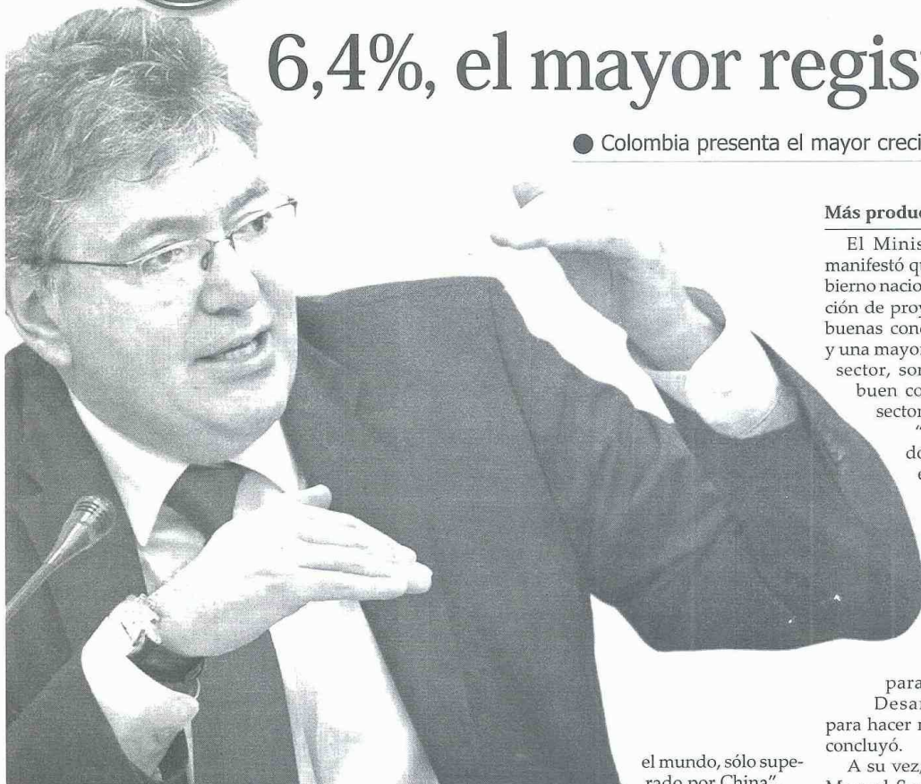
EL MINISTRO de Hacienda, Mauricio Cárdenas, dijo que la economía colombiana presentó el mayor crecimiento de la región.

● Colombia presenta el mayor crecimiento de la región y el segundo del mundo