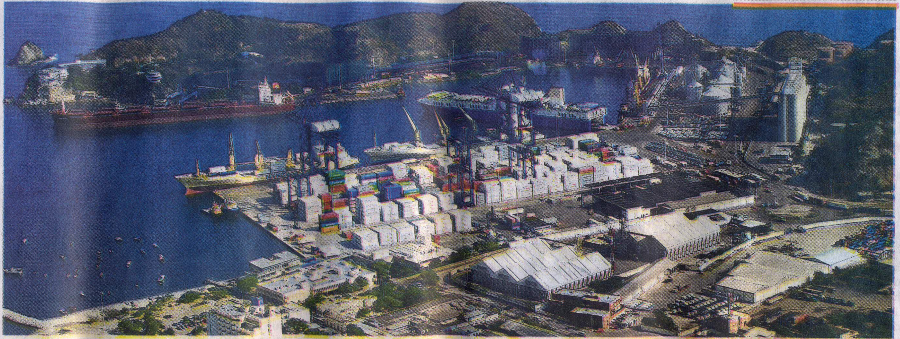
EL CRECIMIENTO portuario y la importancia en un mundo globalizado fueron unos de los temas que se abordaron ayer en este encuentro.

conjunto de las importaciones y exportaciones fueron por vía marítima a corte de 2010.