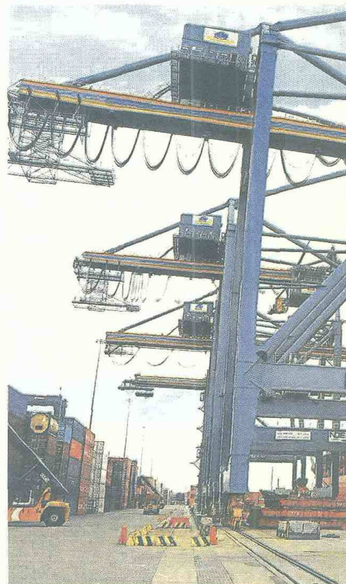
El puerto de Cartagena debe mejorar su acceso marítimo antes de que se inaugure la ampliación del Canal de Panamá.

"Se requiere un mayor desarrollo del litoral Pacífico que equilibre las condiciones existentes frente al del Atlántico, y se utilice la conectividad directa del país con los mercados asiáticos", puntualizó.