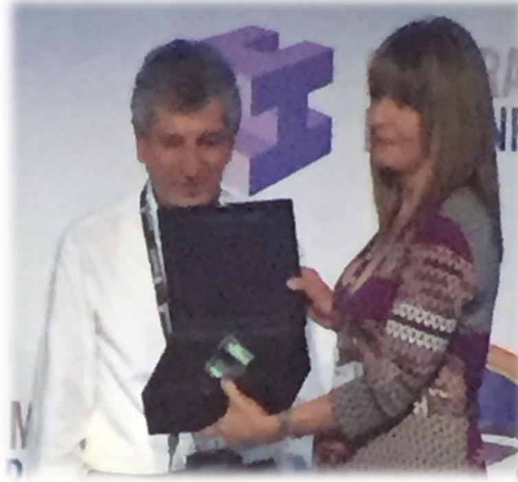
Premio Nacional de la CCI a la Excelencia en Responsabilidad Social Empresarial 2015