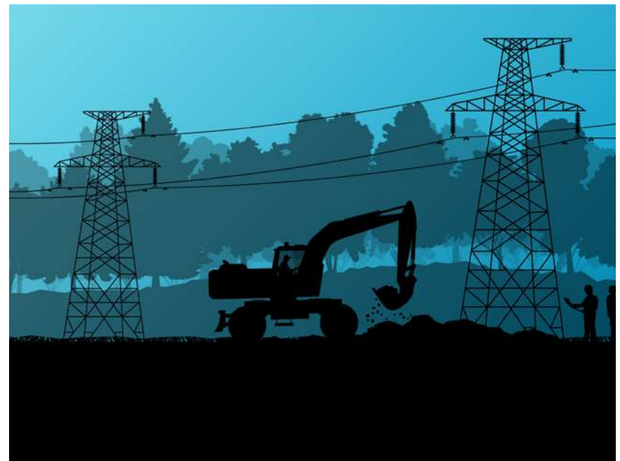
Encuentre las grabaciones del conversatorio en el canal de YouTube de El Heraldo.