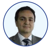
Juan Esteban Gil, director del Invías.

Esta cartilla se complementará con la guía de precios estándares especializados por regiones que se está trabajando con la Universidad Nacional, lo que permitirá facilitar los procesos de contratación y continuar la labor del sector con el fin de generar transparencia en los procesos”.