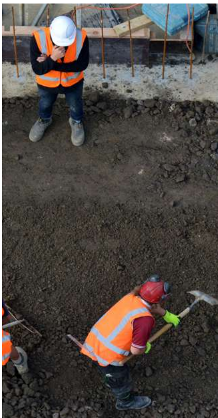
La CCI Occidente trabaja en pro del fortalecimiento de las Pymes de ingeniería.

dentro de las acciones del plan. Además, la CCI Occidente ha insistido en la implementación de los anticipo y el pronto reconocimiento de los costos asociados a la implementación de los protocolos de bioseguridad como mecanismos para impulsar la sostenibilidad de las empresas contratistas.