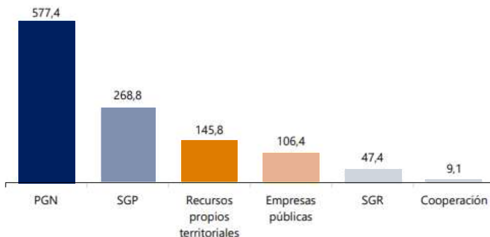
Gráfica 1. Fuentes que financian el PND 2022 – 2026, inversión total $1.154,8 billones